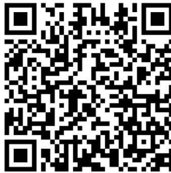
(สิ่งที่ส่งมาด้วย 4)