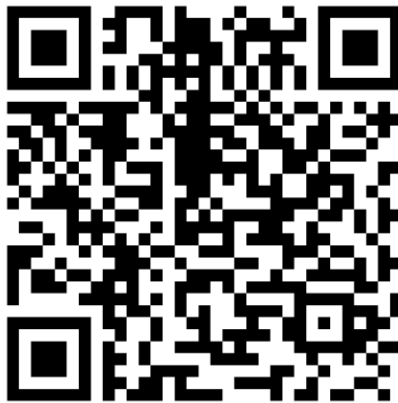
(เอกสารแนบที่ 5)

1. โปรดกรอกเอกสารแจ้งความประสงค์เข้าร่วมประชุมผ่านสื่ออิเล็กทรอนิกส์ (E-AGM) (เอกสารแนบที่ 5) โดยขอให้ท่านระบุ อีเมล (E-mail) และ หมายเลขโทรศัพท์มือถือของท่านให้ชัดเจน เพื่อให้สำหรับการลงทะเบียนเข้าร่วมประชุม